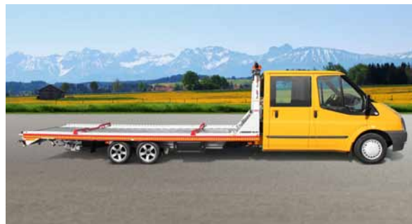
... oder mit Doppelkabine.