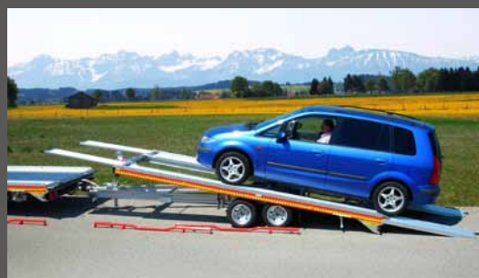
Der Überfahranhänger – ohne Abzuhängen sind Zugfahrzeug und Anhänger beladbar.