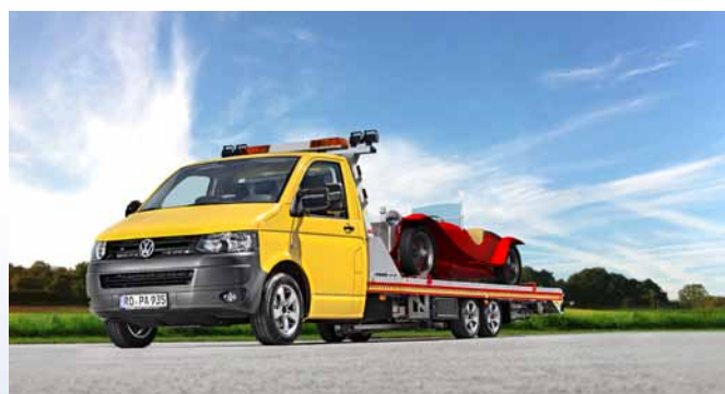
Ob Pannendienst, Neuwagenüberführung oder der Transport von wertvollen Oldtimern – der SPEEDER ist für viele Transportaufgaben zu haben.