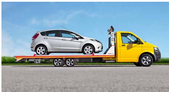
Der SPEEDER als Einzelkabiner...