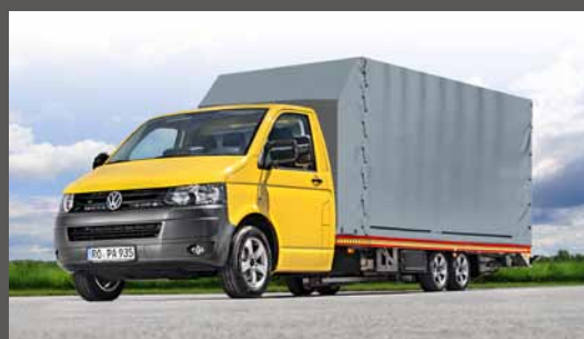
Erweitern Sie Ihren Fahrzeugtransporter mit Kofferaufbauten nach individuellen Anforderungen!

Mit dem Überfahranhänger transportieren Sie zwei Fahrzeuge schnell und komfortabel. Die Fahrzeuge sind durch den Selbstkippsmechanismus des Anhängers und die Überfahrrampen blitzschnell aufgeladen. Bei Leerfahrten fährt der Überfahranhänger einfach auf dem Zugfahrzeug mit.